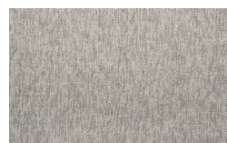
Grigio chiaro 508